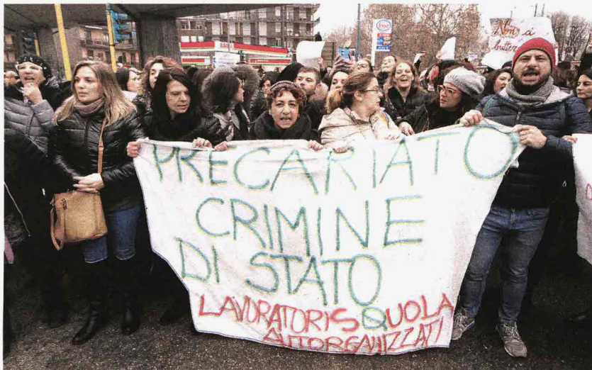
PROTESTA Le maestre diplomate dell'infanzia e delle elementari in corteo a Milano. Sotto, il ministro dell'Istruzione Valeria Fedeli, ex sindacalista, che sta cercando un compromesso

to da viale Trastevere, che in parte è stato chiuso, sede del Miur, al grido di slogan come «contro la sentenza noi facciamo resistenza» e «vogliamo le Gae» e con eloquenti cartelli («abilitate quando serve, licenziate quando conviene» e «no ai licenziamenti di massa»). Nelle scuole italiane diversi disagi per la protesta che secondo i sindacati che hanno promosso l'iniziativa - Anief , Saese e Cub con l'adesione dei Cobas - hanno coinvolto circa 20mila insegnanti precari mentre secondo il Miur si è trattato di un'adesione molto