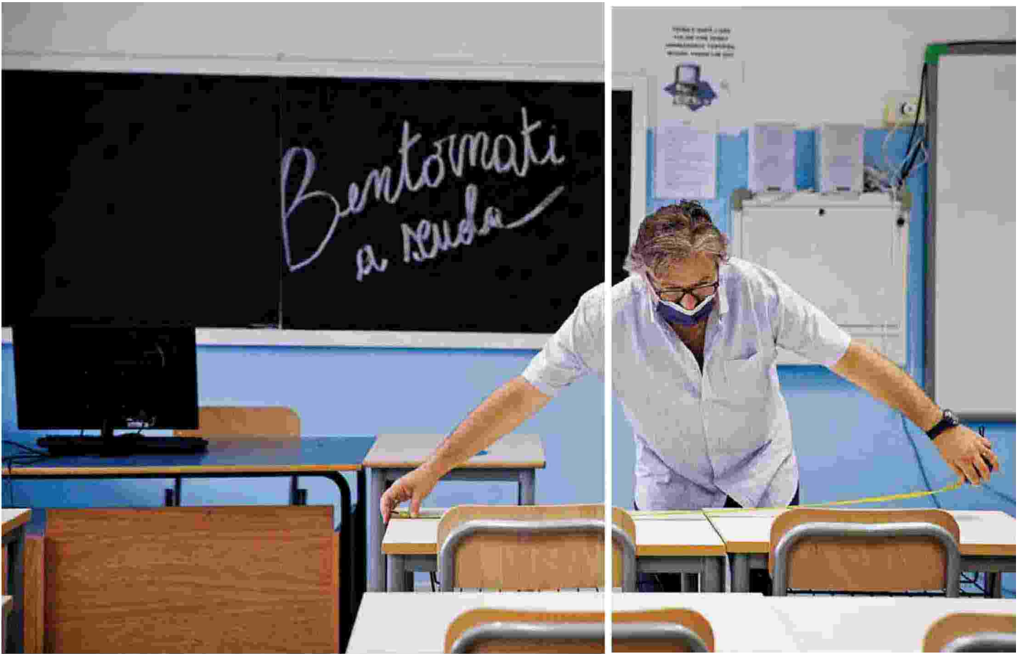
Il liceo Newton di Roma

«La circolazione del virus aumenta tra gli under 12 ma per loro non è ancora disponibile un vaccino»