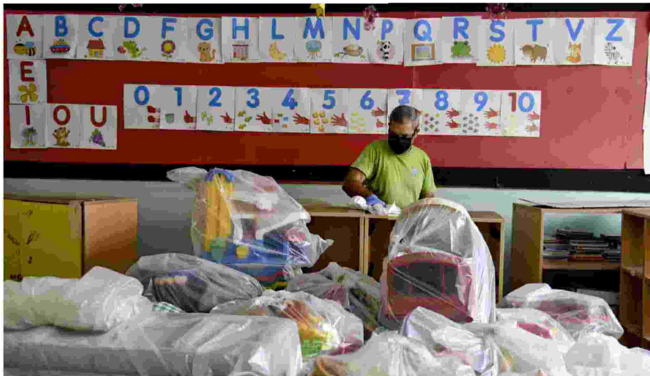
A scuola Le pulizie in un'aula in previsione del rientro in presenza